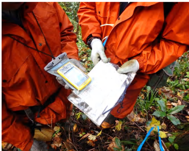
(GPSによる調査対象地の確認・確定)