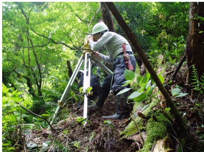
(調査対象地の測量)