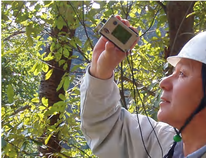
(超音波測定器による樹高の測定)